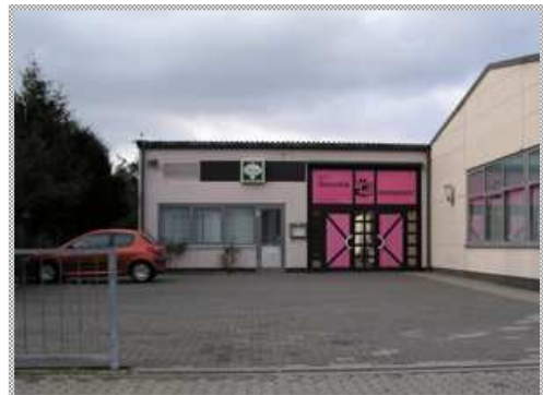
hier liegt nun links von dem Gebäude die Tanzschule Hammersdorf