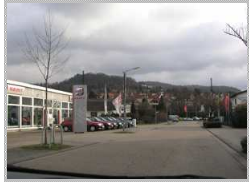
... bis auf der linken Seite ein Seat-Händler (Autohaus Hör) auftaucht