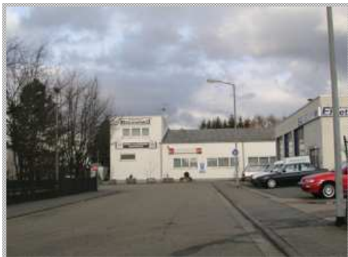
... nach dem Seat-Händler links abbiegen und die Strasse ganz durchfahren, bis ihr auf dieses Gebäude zufahrt ...